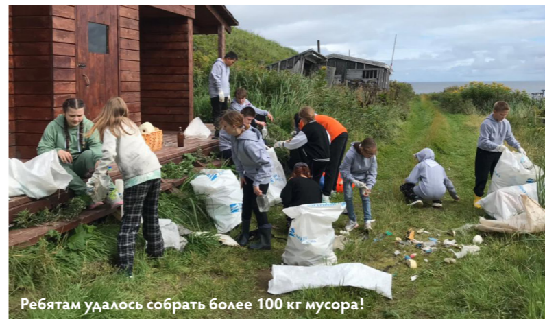
Ребятам удалось собрать более 100 кг мусора!

Всероссийская акция по очистке от мусора берегов водных объектов «Вода России» («Берег добрых дел») — часть федерального проекта «Сохранение уникальных водных объектов» национального проекта «Экология». 🌍