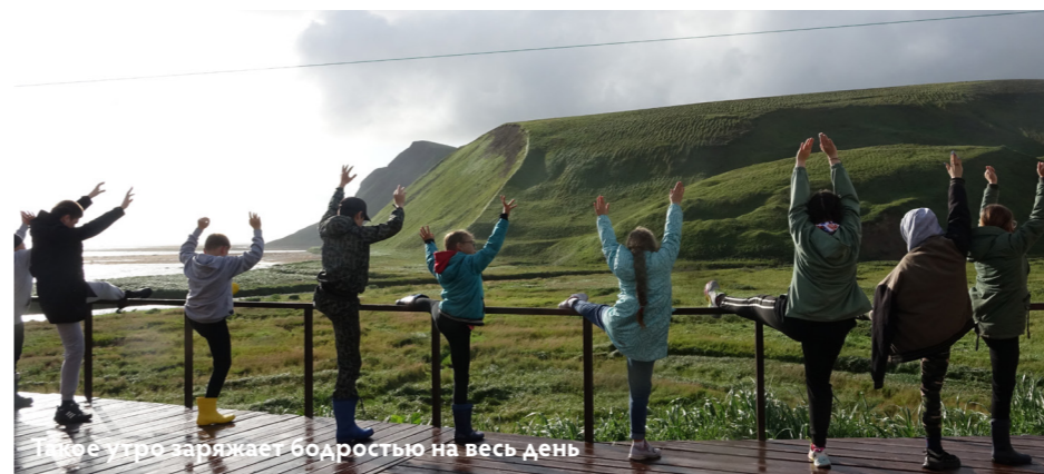
Каждое утро заряжает бодростью на весь день

Каждое утро экспедиции начиналось у ребят с динамичной зарядки - нет ничего полезнее для организма, чем физические упражнения на свежем воздухе. К тому же, такая активность отлично бодрит! После такого и подъём в сопку и походы по побережью не представляют никакой сложности. 🌍