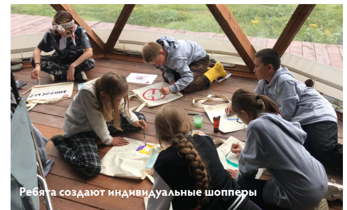
Ребята создают индивидуальные шопперы