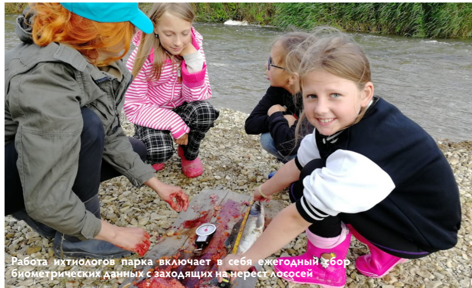
Работа ихтиологов парка включает в себя ежегодный сбор биометрических данных с заходящих на нерест лососей

Промеры рыбы включают в себя массу, промысловую длину, длину по Смитту, массу гонад (половых желез - прощ, молоко и ястыков с икрой), пол и стадию зрелости рыбы. Кроме того, в таблице фиксируются факты наличия укусов на теле рыб - многие животные охотятся на них во время пути на нерест. Так же специалистами парка у рыб для последующих анализов берутся фрагменты плавников (нужных для генетических исследований), отолиды и чешуя. 🌍