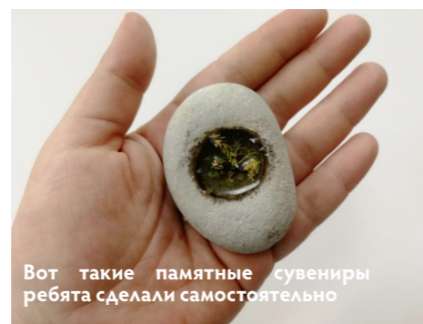
Вот такие памятные сувениры ребята сделали самостоятельно

Использование эпоксидной смолы позволяет сохранить природные объекты в качестве сувенира и создать индивидуальное украшение на любой вкус!