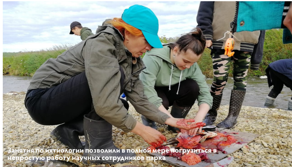
Занятия по ихтиологии позволили в полной мере погрузиться в непростую работу научных сотрудников парка

На занятии по ихтиологии ребята смогли узнать много нового. Научные сотрудники парка рассказали о предмете изучения этой науки, о том, какими методами учёные изучают рыбу и зачем это нужно. Кроме того, специалисты парка научили детей самих проводить ихтиологические исследования - как правильно измерять массу и длину рыбы, как вычислять плодовитость самок, причём промеры ребята делали самостоятельно! 🌍